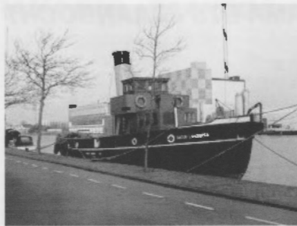
JACOB LANGEBERG WORMERVEER

Na afloop van deze vergadering volgt een presentatie door iemand van de "Stichting Stoomschip Jacob Langeberg in de vaart" over dit al jaren aan het Zuideinde liggende stoomschip. Aansluitend hierop een hapje en een drankje.