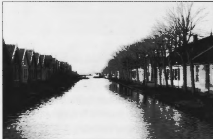
Sluispad en Oversluispad omstreeks 1920/1930