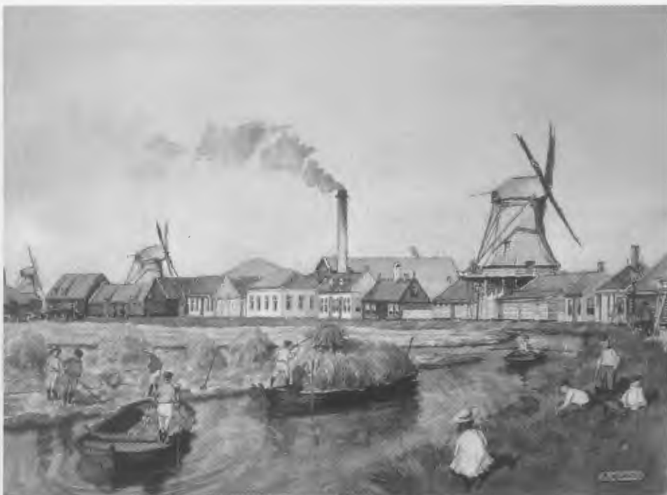
Hooitijd op de Zuid omstreeks 1880. De Zandijkerweg met onder andere de molens De Samson en Het Witte Paard. Afbeelding uit de kalender Oud Wormerveer 2012.

Zoals in de vorige Nieuwsbrief al is aangekondigd, komt er na vier jaar eindelijk weer een echte HVW kalender. De in Wormerveer geboren en getogen zanger zal rond kwart voor elf tijdens de Najaarsbraderie het eerste exemplaar officieel in ontvangst nemen. Op die dag zal de kalender ook voor het eerst te koop zijn. Het is weer een prachtig exemplaar geworden met een serie bijzonder fraaie prenten van Oud Wormerveer van de hand van 'huiskunstenaar' Arnold de Lange. Dankzij de medewerking van een flink aantal plaatselijke ondernemers kan de kalender aangeboden worden voor de lage prijs van €14,50. De opbrengst komt ten goede aan de HVW clubkas. Uiteraard mag deze prachtige kalender in geen enkel Wormerveers huis ontbreken.