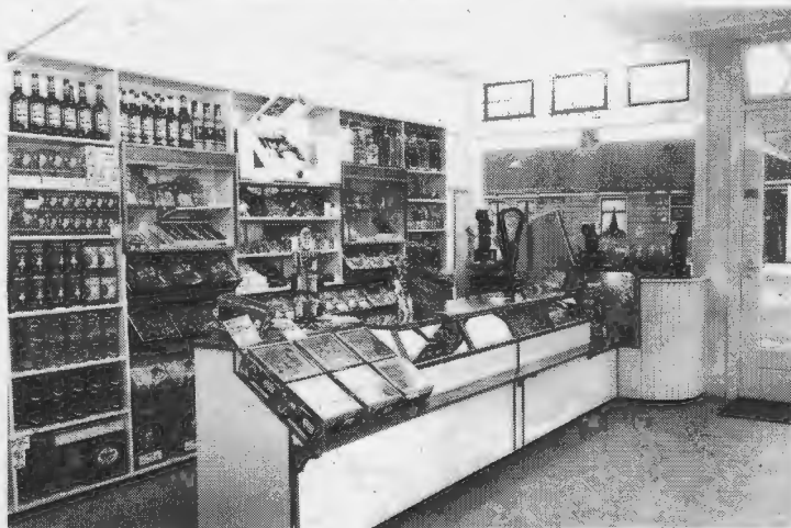
Interieur van de kruidenierswinkel van Pot op de Marktstraat, een van de ruim 50 kruidenierswinkels die Wormerveer ooit telde.

volop in de belangstelling in verband met de voorgenomen sloop en nieuwbouw. Veel foto's en tekeningen zullen te zien zijn en ook een bijzonder fraai schaalmodel van de Zaanbrug wordt geëxposeerd. Heeft u speciale herinneringen aan de Zaan-