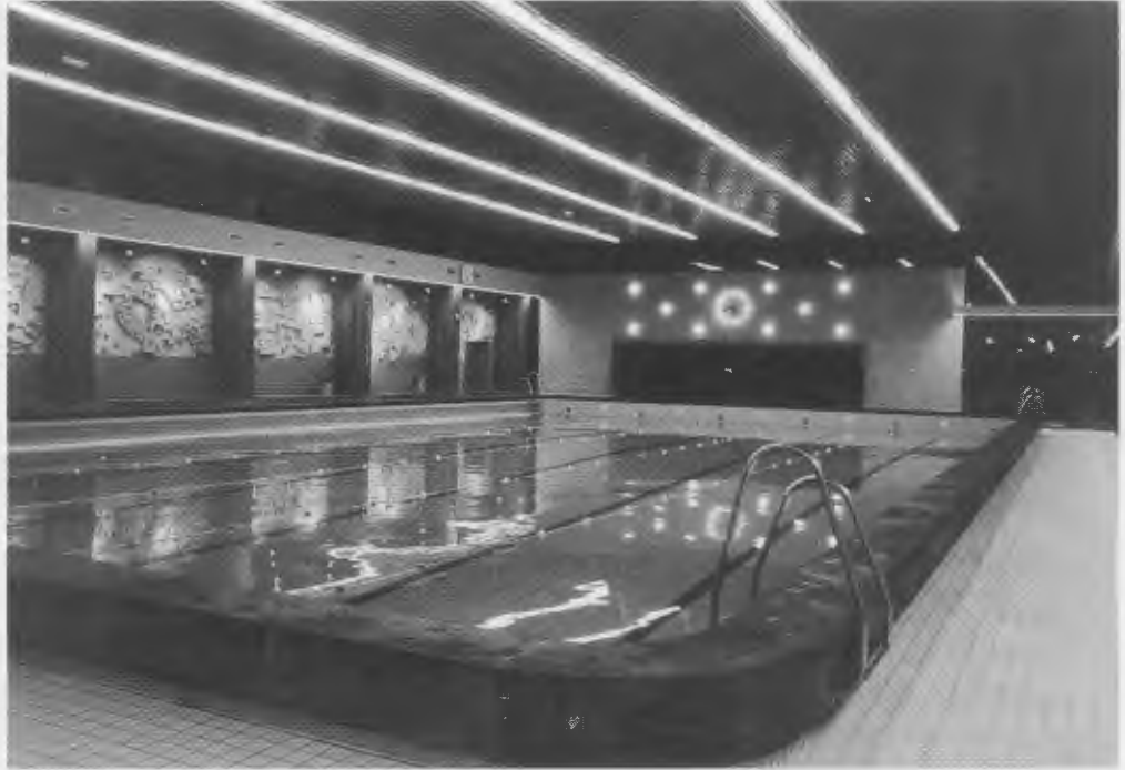
Interieur zwembad De Watering 1970.

Het duurt nog even maar de voorbereiding voor de traditionele Jaardag is al in volle gang. Twee thema's zijn al bekend: de Wormerveerse kruideniers en de Zaanbrug. In Wormerveer Weleer nr. 14 is een opsomming gepubliceerd van de meer dan 50 (!) kruideniers die er in